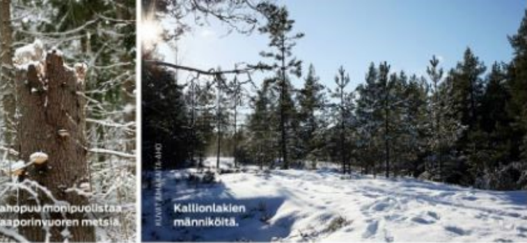
Ohopuu monipuollista taaporinvuoren metsiä.