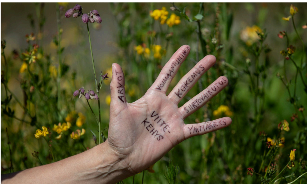
Kuva 1. Aidossa ympäristössä oppimisen malli eli niin sanottu Real World Learning -käsimalli.

Mallissa ymmärrys tarkoittaa kasvatuksen tieteellistä perustaa ja siirtovaikutus opitun yhdistämistä omaan elämänpiiriin. Kokemus viittaa puolestaan siihen, että oppijat pääsevät kokemaan kaikin aistein ympäristöään. Voimaantuminen tarkoittaa osallistumista toimintaan ympäristön puolesta, mikä auttaa toimimaan kestävästi myös tulevaisuudessa. Arvot puolestaan vaikuttavat asenteisiin ja toimintaan: ihmisyyden ja planeettamme arvostaminen on välttämätöntä kestäväen elämäntavan edistämiseksi.