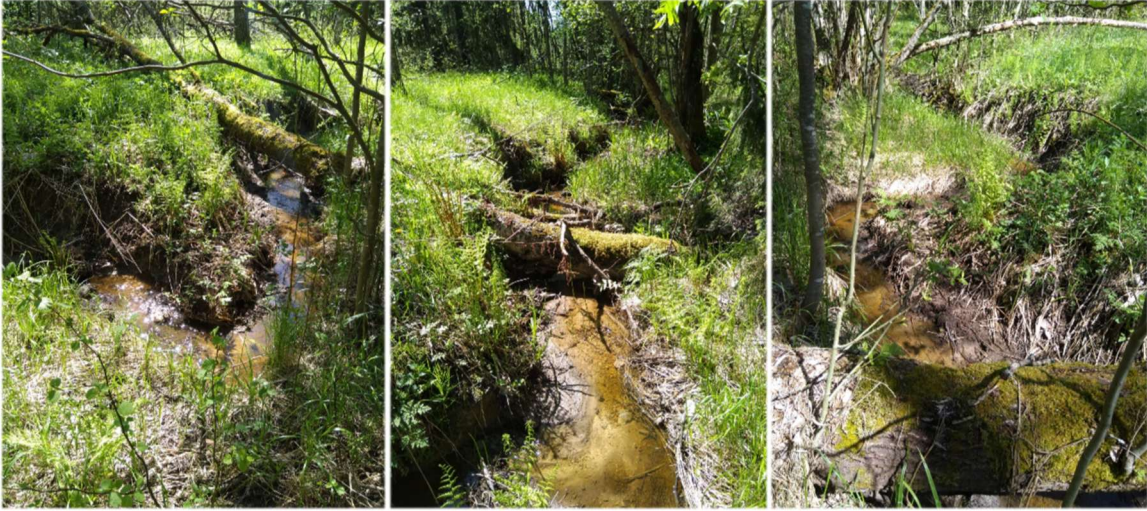
Kuvia Karnalanojan meanderoinnista, Kuvat: Sara Käkälä