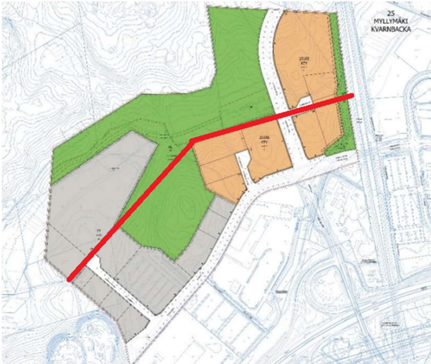
Pohjakuva: Asemakaavaehdotuksen kaavakartta 25.3.2026. 251500 - Vehkalan länsipuoli 2 Asemakaavan ja asemakaavamuutoksen selostus

Faunatican luontoselvityksessä merkittyjen lehtoalueiden 38, 39 ja 40 päälle osoitetusta rakentamisesta tulee luopua. Alla olevassa kuvassa on merkitty punaisella viivalla raja, jonka pohjoispuolen tie- ja rakennussuunnitelmat eivät ole hyväksyttäviä. Lisäksi puiden kaatamisen ja maanmuokkauksen tulee pysyä tonttien sisällä, eikä ulottua niiden ulkopuolelle.