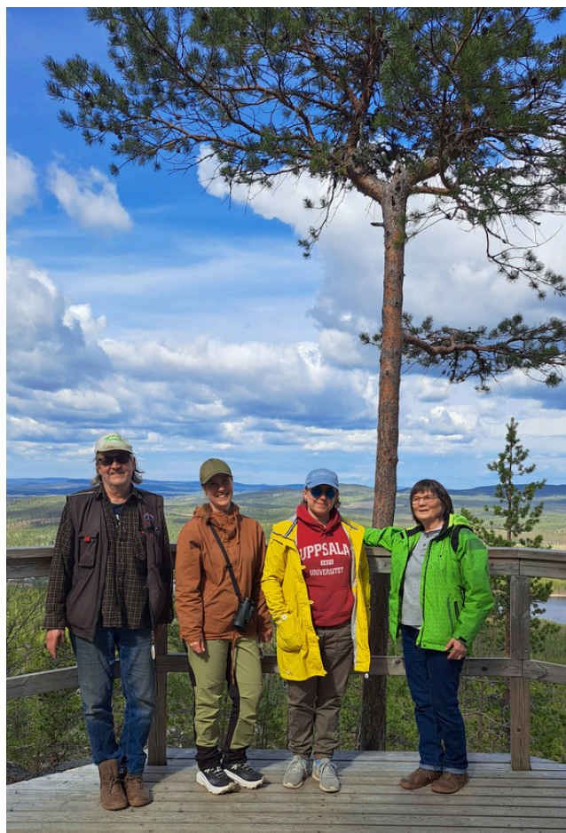
Ylitornion-Pellon Luonto ry:n hallituksen porukkaa Aavasaksan maisemissa 17.6.2026

- Meillä on Mellajärvellä oma aapasoiden ympäröimä Luontotapio-kämpä, jonka pitkokset kunnostamme valmiiksi tänä vuonna. Kämpälle on matkaa kävellen kolme kilometriä ja sen huolto edellyttää suunnittelua. Talvisin on hiihtäen hyvä vetää ahkiossa sinne tarpeita. Kämpä on kaikkien vapaasti käytettävissä. Syksyllä jatkamme myös metsäpalstansa vapaaehtoisesti suojelleen maanomistajan kanssa metsätiaisten talvehtimistä ja pesimistä helpottamaan ripustettujen pönttöjen huoltoa, sekä valmistelemme hömötiaisille soveltuvia koivupötkelöitä.