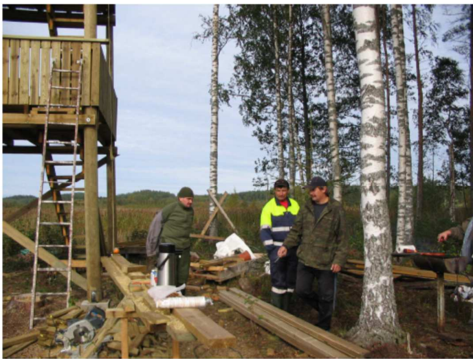
Ruokolahden Kuokkalammen lintutornin rakennustalkoissa syyskuussa 2005.

JK. Voimme myös lähettää palvelukortin sähköisesti! Lähetä pyyntö yhdistyksen sähköpostiin imatralsy@hotmail.com