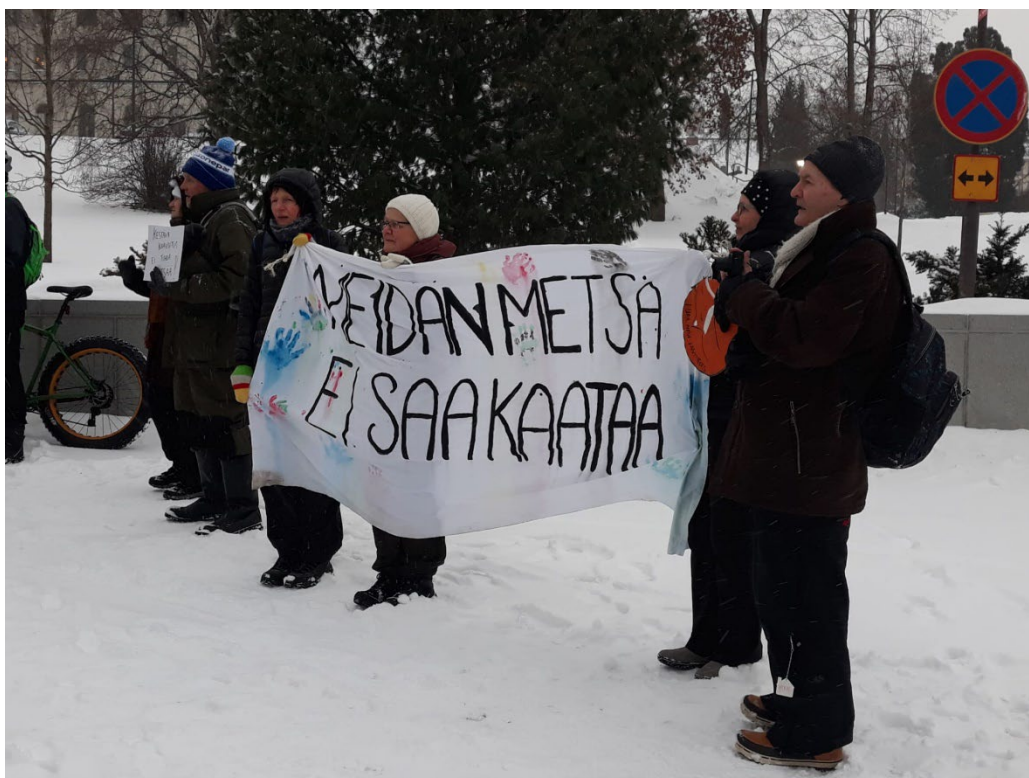
KUVA 5. TAMMIRINTEEN KAAVAN MIELENOSOITUS.

Vesankaan suunniteltu murskaamo valitettavasti etenee Jysyn muistutuksesta huolimatta.