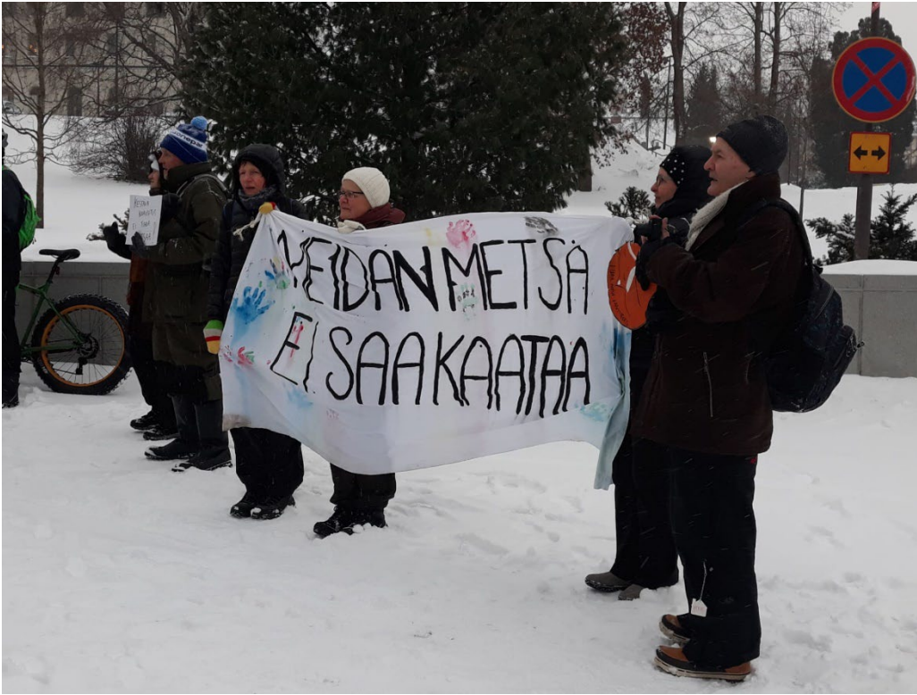
KUVA 5. TAMMIRINTEEN KAAVAN MIELENOSOITUS.

Vesankaan suunniteltu murskaamo valitettavasti etenee Jysyn muistutuksesta huolimatta.