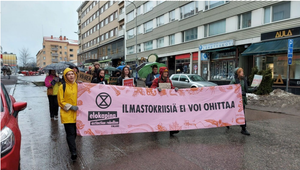
KUVA 3. CLIMATE STRIKE -MILENOSOITUS. KUVA: SLL KESKI-SUOMEN PIIRI.

Olimme mukana 25.3. Climate strike -mielenilmauksessa.