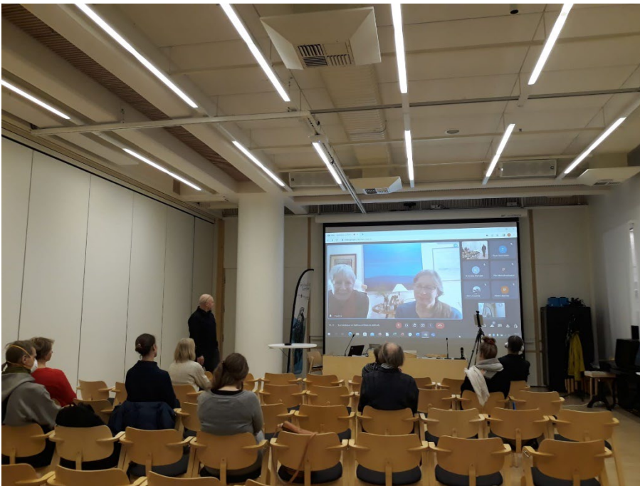
KUVA 1. KOHTUUSLIIKETILAISUUDESTA.

Syyskokouksen yhteydessä laitoimme alulle Kohtuusliikkeen Keski-Suomessa. Pohjoiskarjalainen liike Kohtuus Vaarassa oli kertomassa, kuinka heidän toimintansa alkoi ja on edennyt.