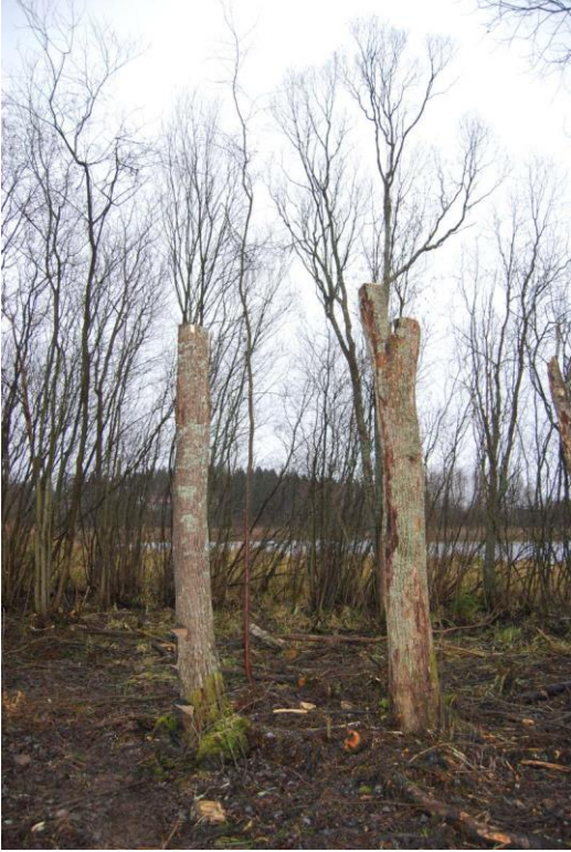
"Luonnontilainen runsalahopuustoinen lehto". Lehdon ominaispiirteitä on vahva kerroksellisuus, monipuolinen pensaskerros.