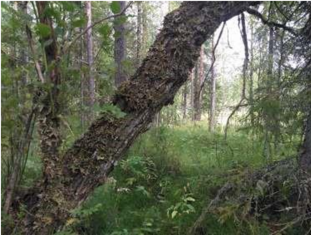
Raidankeuhkojäkälää (NT) vanhalla raidalla Ketveleenpuron laidalla.

Ketveleenpurossa virtauspaikkoja ja kiviä uomassa.