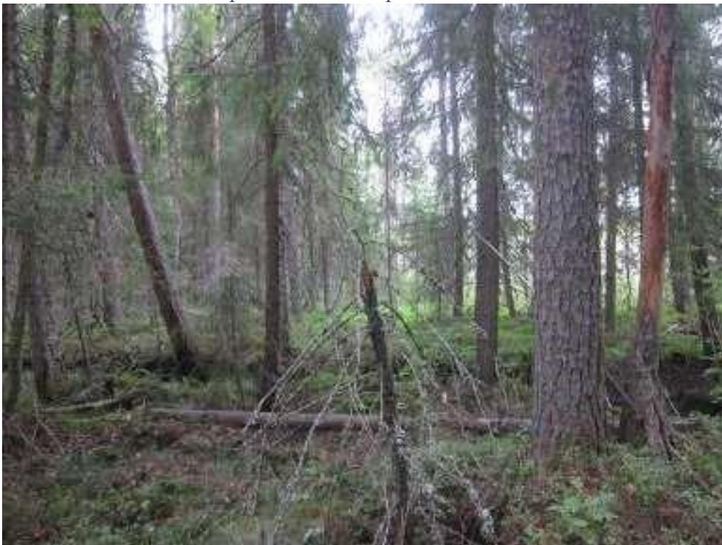
Eri-ikäisrakenteista metsää Mäenaluspuron rannalla Luontotyypit: sarakorpi (EN) keidasräme (NT)