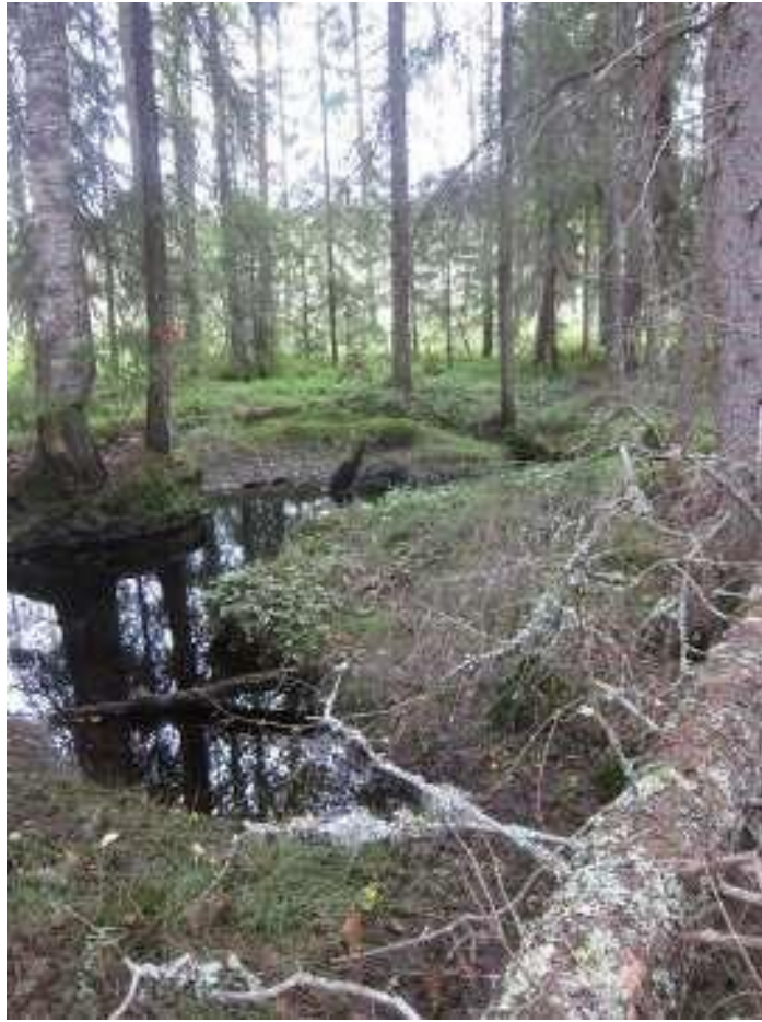
Mäenaluspuro mutkittelee paikoin voimakkaasti.