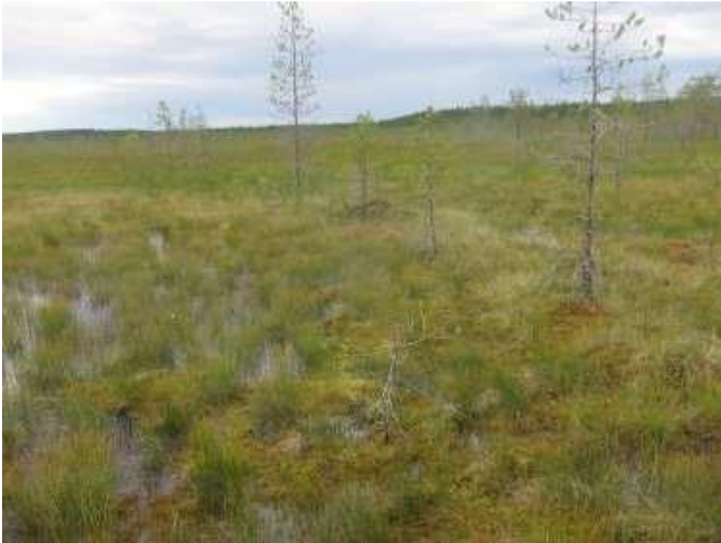
Ketveleensuon ojittamaton osa oli enimmäkseen ombotrofista lyhytkorsinevaa