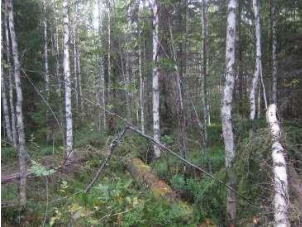
Ketveleenpuronvarren koivuvaltaista metsää, jossa paikoitellen järeää lahoppuuta.

Ketveleenpuron reunametsät on koivuvaltaisia sekametsiä, seassa jonkinverran kuusta ja ylispuumäntyjä. Puusto on eri-ikäisrakenteista, enimmäkseen melko nuorta, noin 50-80-vuotiasta. Puronreunametsissä on yllättävän runsaasti, noin 10m 3 /ha, eri lahoasteista lahoppuuta ja harvinaisia lajeja. Koko puronvarren matkalla on silmiinpistävän runsaasti uhanalaista takkuhankajäkälää ( Evernia divericata , VU). Puron ja pienen lammen varressa paikoin myös korpisuutta.