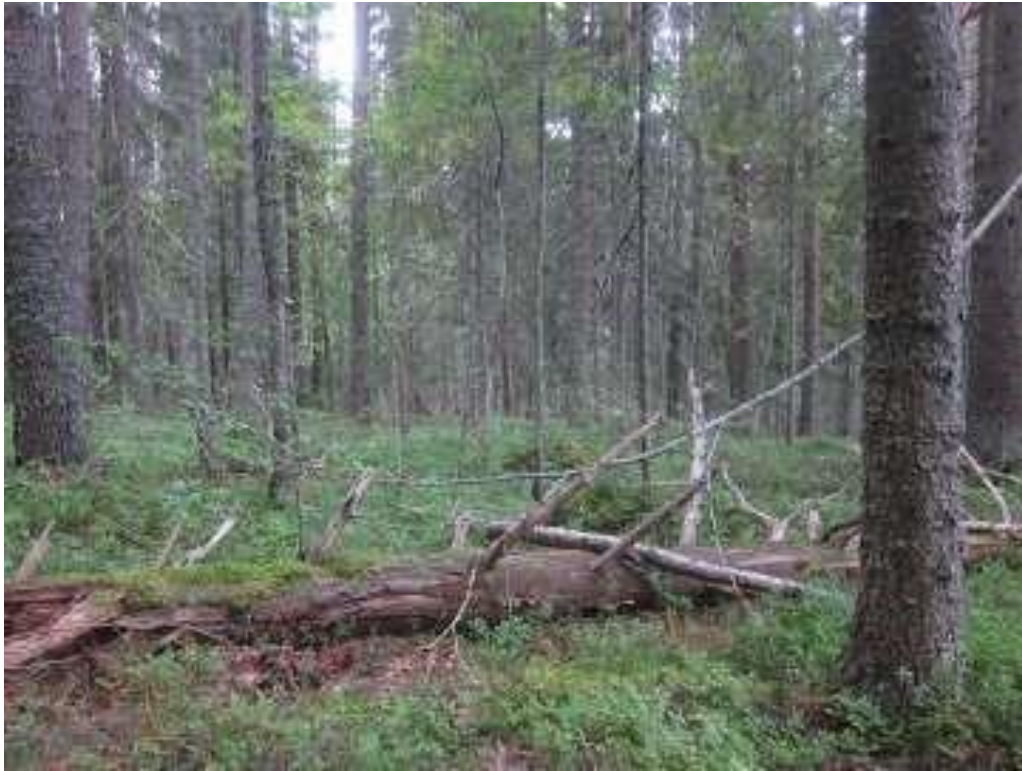
Uudistuskypsää metsää Siikavaaran rinteellä.