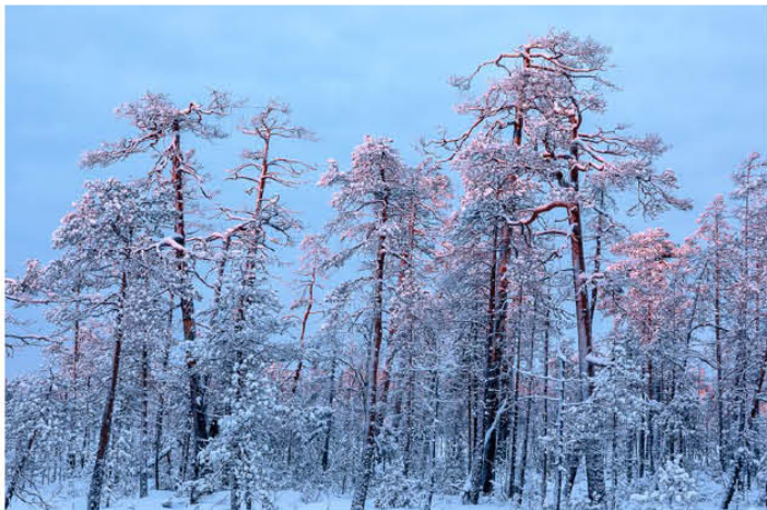
Palokkaan alueen metsät ovat häkellyttävän kauniita Juhani Syväojan kuvissa. Hän esitteli kuvia Palokkaan lumierämaa. Kirjastolla viime viikon tiistaina.