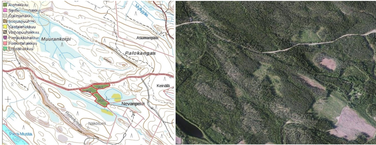
Kuva 1. Vasen kuva: Kuvioille 992, 993 ja 1020 suunnitellut avohakkuut. Oikea kuva: Ilmakuva-alueesta.

Tien vieressä olevat kuviot 992 ja 1020 ovat runsaspuustoisia (992: 382 m 3 /ha, 1020: 382 m 3 /ha) (kuva 1). Tällaisten runsaspuustoisten jo iäkkäiden metsien avohakkuu ei ole virkistyskäyttöalueella perusteltua. Avohakkuuala tulisi näkymään tielle, ja olisi visuaalinen haitta.