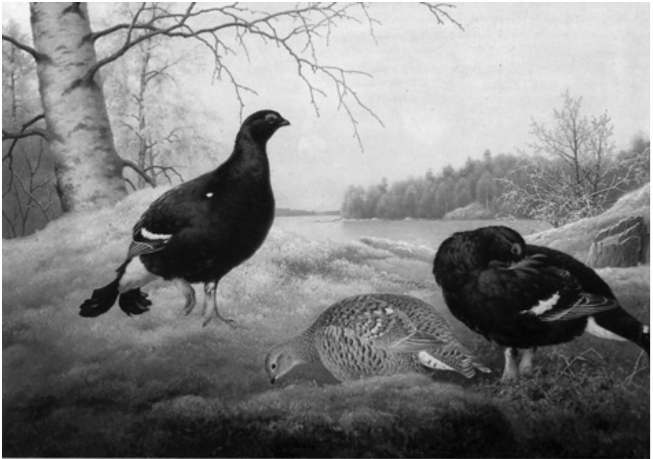
”Teeriä huurteisella rannalla”, Ferdinand von Wright, 1898