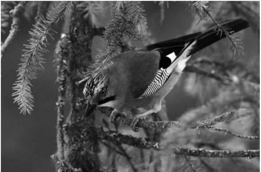
Närhi tarkkailee.