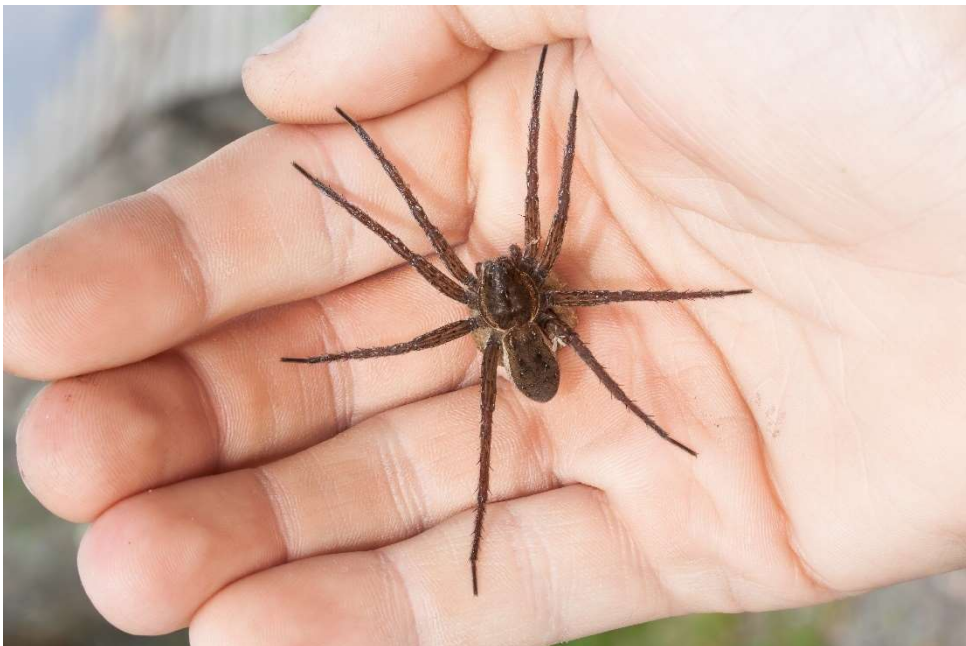
Rantuli kämmenellä.