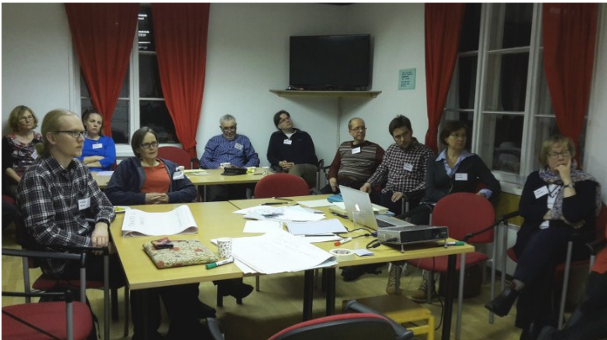
Espyyn jäsenilta keräsi luonnon- ja ympäristönsuojelutoiminnasta kiinnostunutta jäsenistöä Villa Apteekin alakertaan (kuvassa).