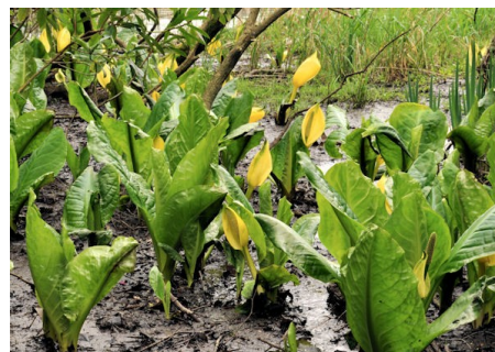
Keltamajavankaali ( Lysichiton americanus )

Näiden tahojen lisäksi kansalaistoiminnan yhteistyötä tullaan kehittämään monipuolisesti myös muiden yhdistysten, järjestöjen ja organisaatioiden kanssa. Hankkeessa on mukana muun muassa kymmeniä kuntia eri puolella Suomea. Vieraslajien torjuntatyöt kohdistuvat ensisijaisesti niiden kuntien alueelle, jotka ovat hankkeen osarahoittajia, mutta moninaista kansalaistoimintaa toivottavasti syntyy myös muissa kunnissa.