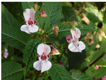
Jättipalsami ( Impatiens glandulifera )

Vieraslajien torjunnan lisäksi hankkeen keskeisenä tavoitteena on kansalaisten innostaminen ja kouluttaminen vieraslajien torjuntatyöhön eri puolilla Suomea niin, että hankkeen loppumisen jälkeen Suomessa olisi vakiintunut kansalaistoimijoiden joukko vieraslajien torjunnassa. Tämän työn apuvälineeksi kehitetään älypuhelimella toimiva kansalaistieteen työkalu, jonka vieraslajihavainnot ja torjuntatiedot voidaan helposti ilmoittaa kansalliseen paikkatietokantaan. Kansalaistieteen lisäksi hankkeen toimenpiteisiin kuuluvat myös torjuntatalkoiden ja koulutusten järjestäminen sekä monipuolinen viestintä.