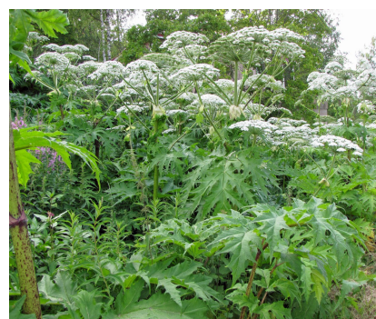
Kaukasianjättiputki ( Heracleum mantegazzianum )

VieKas – eli Vieraskasvi -Life (engl. Invasive LIFE) on Suomen suurin haitallisten vieraskasvilajien torjuntaan keskittyvä, ja ensimmäinen Suomen luonnonsuojeluliiton vetämä LIFE-hanke. Tämä tarkoittaa, että SLL johtaa hanketta ja on päävastuussa hankkeen toteutuksesta. Hanke on 5,5-vuotinen (2018-2023) ja rahoituksesta 60 % tulee EU:n Life-rahastosta. Tämän infopakettin viimeiseltä sivulta löytyy tietoa siitä, miksi haitallisten vieraslajien torjuminen on tärkeää.