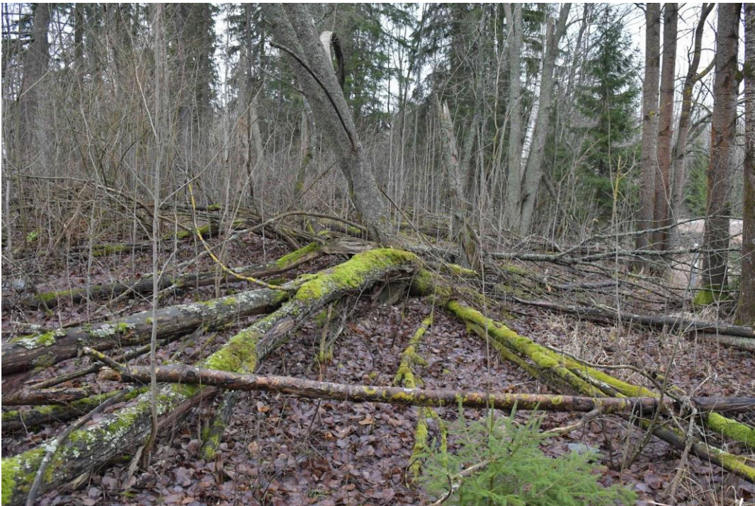
Kuva 1. Erittäin runsaslahopuustoinen, puustoltaan luonnontilaisen kaltainen sekametsälehto niittyalueen lounaispuolella. Tärkeä myös lahokaviosammallelle ja liito-oravalle.

Kaavaprosessissa ei kuitenkaan ole riittävästi tunnistettu alueen eräiden metsien merkitystä luontotyyppisuojelelle. Niittyalueen lounaisreunan lehtoalue on yhdistyksen maastokäynnin havaintojen perusteella erittäin runsaslahopuustoista ja puustorakenteeltaan luonnontilaisen kaltaista METSO I-luokan sekametsälehtoa (kuva 1). Sillä on merkittävää arvoa myös biotooppina eikä pelkästään liito-oravan ja lahokaviosammalen elinalueena. Maastokäynnillä lehto todettiin myös liito-oravan käyttämäksi eli pipanoita löytyi järeän kuusen juurelta (KKJ 6691773:3382152).