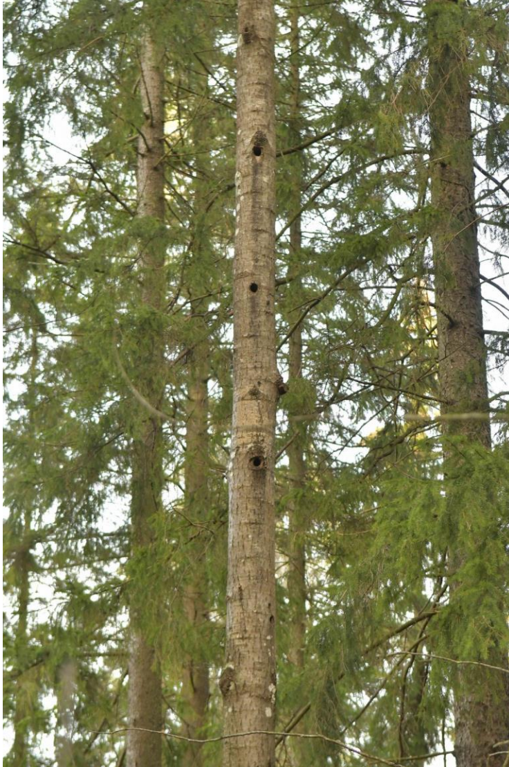
Kuva 3. Useita liito-oravalle sopivia koloja sisältävä haapa niittyalueen itäpuolella.