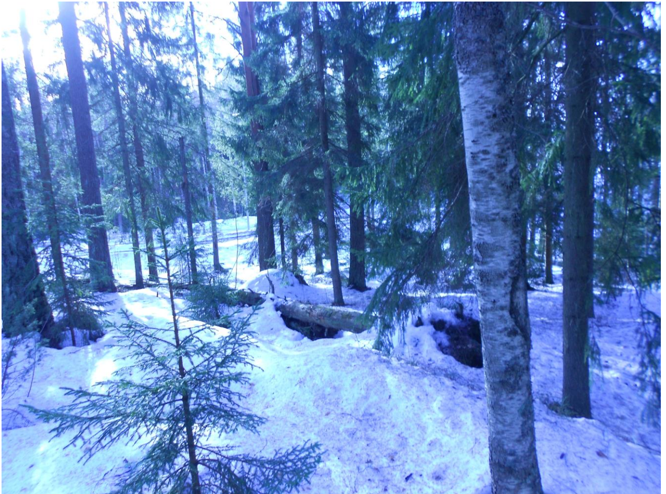
Kuva 1. Luonnontilaisen kaltaista ja kohtalaisen lahopuustoista, METSO II-luokan vanhahkoa sekametsää kaavavarauksen A86006 alueella.