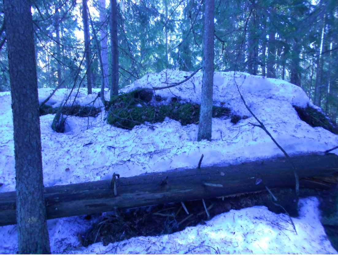
Kuva 2. Vaateliaan lajiston kannalta hyvin potentiaalinen kuusimaapuu Sumpputien eteläpuolisen A86006 alueella.