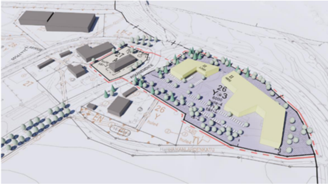
Kuva 36. Ote maankäyttösuunnitelman työmallista pohjoisosan kaava-alueiden kohdalta. Ratkaisu on tältä osin esitetty samana kummassakin vaihtoehtoluonnoksessa. Rakennusmassoista on pyritty muodostamaan hyvin muurimaisia tiealueiden melun suuntaan. Alueen porttina pääsaapumissuunnassa sijaitsevaan kortteliin on mahdollista sijoittaa esimerkiksi kaupungin julkisia toimintoja, hallinnollisia tiloja ja päivittäistavarakauppa. Korttelialueen eteläreunalla pyritään säilyttämään olemassa olevaa puustoa. (Lähde: Ramboll, 2021)

Mielestämme rakennusoikeutta on vähennettävä ja se on pystyttävä sovittamaan nykyisten asuntolarakennusten paikalle Arkkitehtitoimisto Harris Kjisik Oy:n kaavaselosteen kuvassa 33. suunnitteleamalla tavalla. (Pitkäniemen Masterplanin päivitys, 23.01.2020)