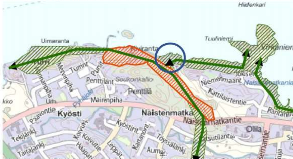
Kuva. Ote Pirkkalan keskustan yleiskaavan luontoselvityksen liitekartasta 3. arvokkaat luontokohteet, rakentamisen ulkopuolelle jätettäväksi suositeltavat alueet (Ramboll Finland Oy, 2012). Kartassa on osoitettu punaisella rasterilla erityiset luontoarvoalueet, vihreällä rasterilla ekologist käytävät ja suojavyöhykkeet ja vihreällä nuolella Pirkkanmaan maakuntakaavan mukaiset viheryhteydet. Kaavamuutosalueen sijainti on osoitettu kuvassa sinisellä ympyrällä.

Pirkkalan kunnan alueelle vuonna 2009 laaditussa lepakkoselvityksessä (BatHouse, 2009) kaavamuutosalueen läheisyydestä on havaittu pohjanlepakko. Selvityksessä on osoitettu II-luokan lepakkoalue, joka on tärkeä ruokailualue kaavamuutosalueen länsipuolelle ja Soljantie on osoitettu lepakoiden siirtymäreitiksi. Alueen arvo lepakoille on huomioitava maankäytössä (EUROBATS -sopimus).