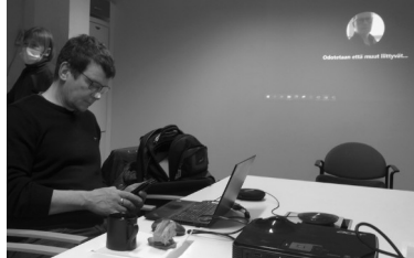
Kuvat 1-2. Hallituksen kokouksia.