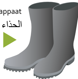
Kumisaappaat الحذاء المطاطي (حذاء برقبة)