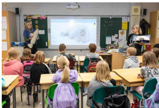
Utran koululaiset Joensuussa pääsivät tutustumaan saimaannorpan elämään lokakuussa.