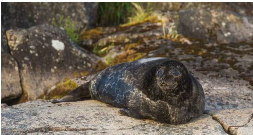
Saimaannorpalla pyyhkii juuri nyt melko hyvin, mutta jo yksi huono pesimätalvi yhdistettynä nykyisen kaltaiseen kalanpyydyskuolleisuuteen voi kääntää tilanteen toiseen suuntaan.

Kannanarvioinnin yhteydessä Metsähallitus julkaisi uuden Norppatilanne-palvelun . Sinne on koottu vuoteen 2022 asti tiedot norppakannan koosta, syntyneistä ja kuolleista sekä kannan kasvusta, ja kaikki vesistöalueittain. Vuoden 2023 tiedot löytyvät täältä , ja vuoden lopussa kuluvan vuoden kokonaistiedot siirretään Norppatilanne-palveluun.