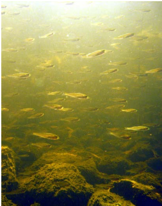
Ruoaksi kilokaupalla pikkukalaa, hengittämistä varten avantoja ja unelmana kunnan kinokset. Siinä saimaannorpan talvisuunnitelmat!

Itä-Suomen yliopiston keinopesätutkimuksista on ilmestynyt tieteellinen artikkeli vuonna 2022.