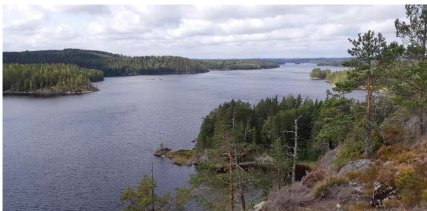
Saimaa ei nykytilassa täytä UNESCO:n maailmanperintökohteen kriteereitä. Saimaannorppa yksistään ei riitä statuksen saamiseen.

Päätös oli pettymys, mutta myös muistutus siitä, että eliöyhteisöt ja ekosysteemit ovat kokonaisuuksia. Emme voi suojella saimaannorppaa erillään koko Saimaan muusta luonnosta ja lajeista. Lisäksi ihmisen vaikutus on Saimaalla voimakas, eikä laajoja erämaisuuksia suojelualueita juurikaan ole.