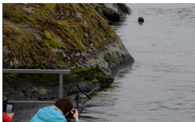
Kuutin kellunta ja polskinta Olavinlinnan kupeessa hurmasi savonlinnalaiset lokakuun puolessavälissä.