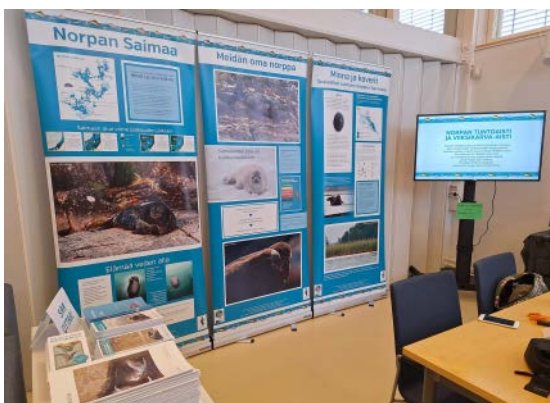
Norpan Saimaa -mobiilinäyttely on esillä Ruokolahden kirjastossa 26.11. asti.