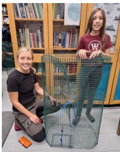
Saimaa-katiska valmistui Elinan ja Alman käsissä seuraavaa Vaihda verkot katiskaan -tapahtumaa varten.