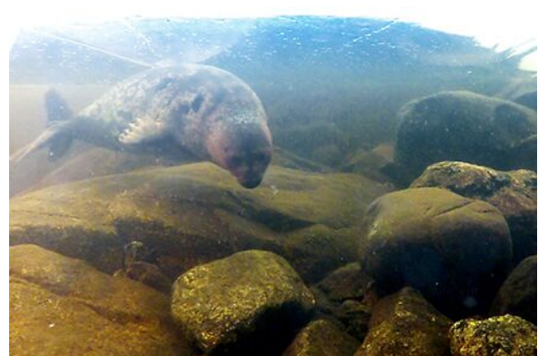
Norpan koti- ja lempparimaisemaa veden pinnan päällä ja alla.

Muistathan seurata norppatiedotusta myös täältä: