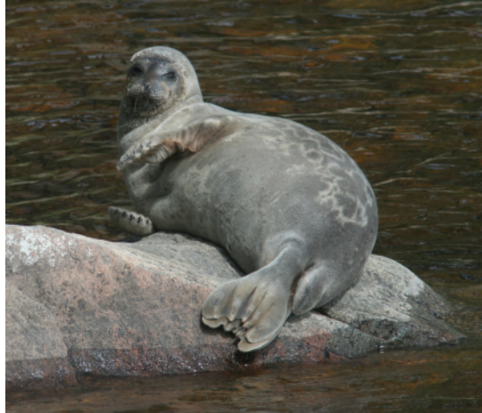
Älä häiritse minua!

Ydinviesti oli, että norppa ei ole vielä suojeltu, se on välittömän sukupuuton uhan alla ja uhkatekijöinä ovat edelleen kalanpyydyskuolleisuus, ilmastonmuutos, pieni geneettinen variaatio sekä ihmislähtöinen häiriö. Työtä norpan pelastamiseksi siis tarvitaan edelleen. Love Saimaa -verkosto veikin viestiä eteenpäin mm. hallitusneuvotteluihin.