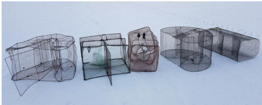
Saatavilla on hyvin monenlaisia katiskoja. Oikealla olevat Saimaa- ja Weke-katiskat ovat rakenteeltaan valmiiksi norppaturvallisia eli niiden nielu ei leviä yli 15 senttimetriä. Vasemmanpuoleiseen katiskaan on lisätty nielurajoin, mikä tekee siitä norppaturvallisen. Toinen ja kolmas katiska vasemmalta lukien ovat löysänieluisia ja surmanloukkuja kuuteille.

Jokainen norpan kalanpyydyskuolema on suuri menetys. Jo pelkästään siksi, että saimaannorppia on niin vähän, mutta erityisesti siksi, että heiveröisestä kannan kasvusta huolimatta norppien perimä on kapea ja geneettinen monimuotoisuus pienenee koko ajan. Nuorten norppien menettäminen aiheuttaa geenivaranon menetystä, kun norppa ei koskaan pääse lisääntymään.