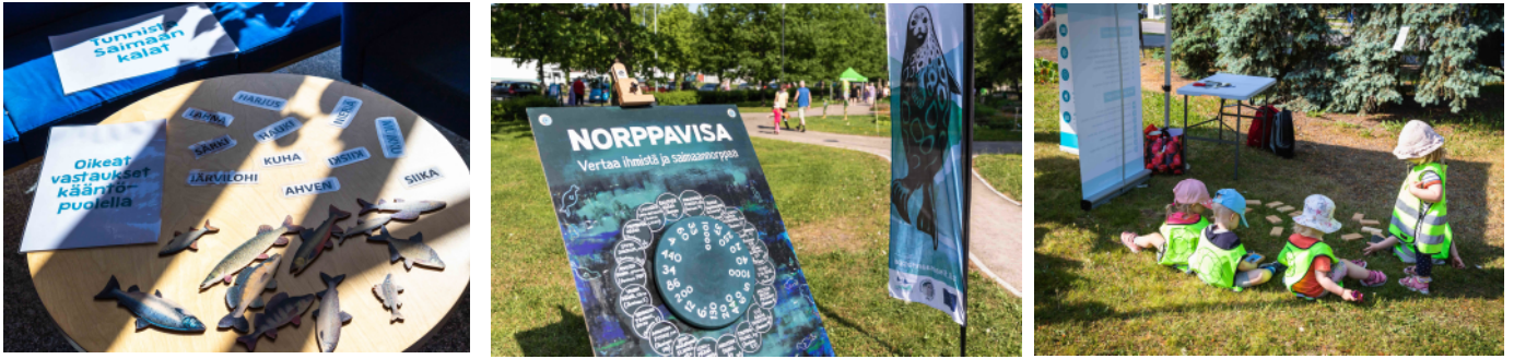
Muun muassa kalojen tunnustusta, norppavisiaa ja muistipeliä on tarjolla lapsille ja perheille suunnatuissa tapahtumissa.

Tulevat tapahtumat näkyvät tapahtumakalenterissa sivulla 2. Näissä kaikissa tapahtumissa on toimintaa ja/ tai materiaalia jaossa myös perheen pienimmille.