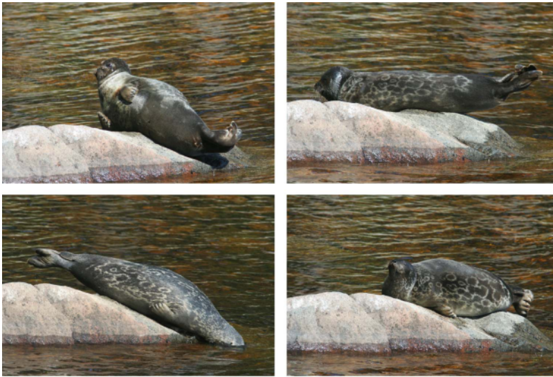
Ota kesän päivärutiineihin mukaan norpan kesäjumppa. Se pitää vartalon notkeana ja mielen virkeänä.