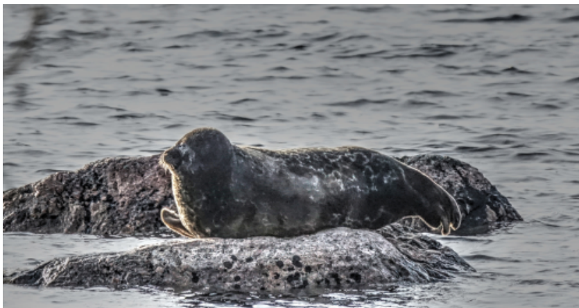
Venla on tiettävästi vanhin saimaannorppa. Se on myös ensimmäinen Saimaan sisällä siirretty saimaannorppa. Siirto tehtiin 1990-luvun alussa Haukivedeltä eteläiselle Saimaalle. Viimeksi Venla on kuvattu syksyllä 2022, joten se on jo reilusti yli 30-vuotias ja moninkertainen isoäiti.

Siirtoistutukset ovat kiireellisiä, ja ne pyritään aloittamaan mahdollisimman pian. ELY-keskuksen lupa on voimassa vuoden 2027 loppuun asti.