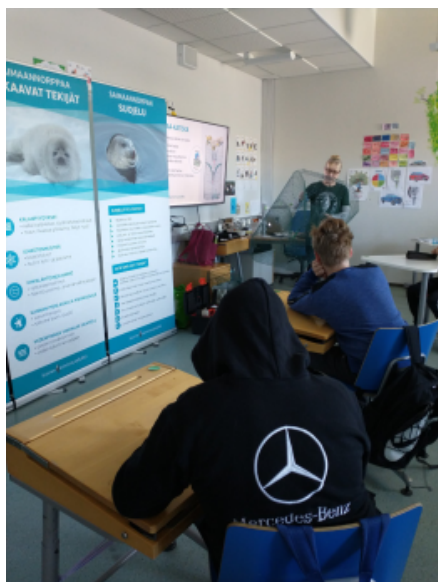
Katiskatalkoissa ja -työpajoissa kerrotaan aina aluksi osallistujille, mistä norppaturvallisessa kalastuksessa on kysymys. Johdanto katiskan rakentamiseen sisältää tietoa saimaannorpasta, norppaturvallisesta kalastuksesta ja Saimaa-katiskasta. Kimpisen koulu, Lappeenranta.

Monissa muissakin tapahtumakalenterissa mainituissa kesätapahtumissa norppaturvallista kalastusta esitellään yleisölle.