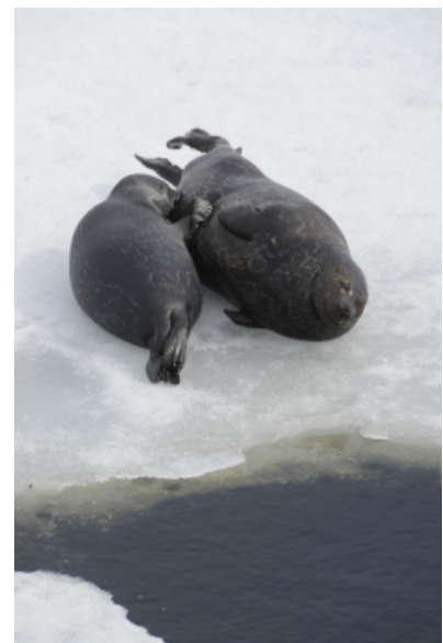
Saimaanorppaemo jatkaa kuutin imettämistä toukokuulle saakka viimeisillä kevätyäillä.

Lisäksi Saimaa- ja norppa-asioita on vaihtelevasti esillä myös muilla luonnonsuojeluliiton Saimaan alueen piirien ja paikallisyhdistysten sivuilla.