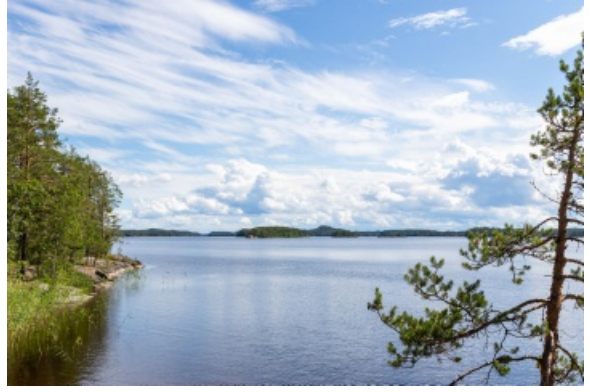
Saimaan saaristo tarjoaa kauniita maisemia.

Matka UNESCO:n maailmanperintökohteeksi on vielä kuitenkin pitkä. Lokakuussa raportti etenee IUCN:n maailmanperintöpaneelin kokoukseen ja tammikuussa saadaan uutta tietoa hankkeesta. Jos esiarviointiprosessi menee hyvin, on varsinainen hakemus mahdollista toimittaa Unescon maailmanperintökeskukselle vuoden 2024 alussa. Silloin alkaisi yli vuoden kestävä arviointikierrös. Maailmanperintökomitea voisi siis tehdä päätöksen hakemuksesta kesällä 2025.