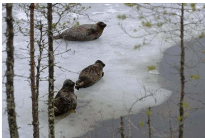
Talvea ja jään tuloa odotellessa.

Syksy on alkanut vauhdikkaasti erilaisten tapahtumien järjestämisellä ja suunnittelulla. Olemme olleet mukana Ilmastofestari-kiertueella, jossa jaetaan ilmastotietoutta ja -ratkaisuja yläkoululaisille ja lukiolaisille nuorille. Ilmastofestari järjestää Etelä-Karjalan liitto, ja festarit kiertävät syksyn aikana maakunnan pienten kuntien kouluja. Suomen luonnonsuojeluliitto (Yhteinen saimaannorppamme LIFE -hanke) opastaa nuoria norppaturvallisen katiskan rakennukseen ja kalastukseen. Tästä lisää alempana uutiskirjeessä.