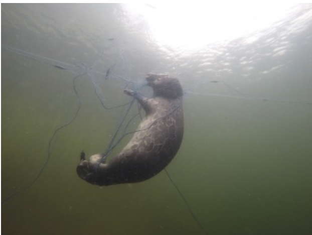
Vaikka nuorilla kuuteilla on suurin riski kuolla verkkoihin, niihin kuolee myös aikuisia norppia ympäri vuoden. Tämän vuoksi on hyvä muistaa ettei yksikään kalaverkko ole norppaturvallinen.

Verkkoon on tänä vuonna kuollut jo kolme norppaa. Helmikuussa löytyi ensimmäinen verkkoon kuollut, todennäköisesti viime vuonna syntynyt urosnorppa. Luonnonsuojeluliitto painottaakin, ettei verkkokalastus ole norppaturvallista myöskään rajoitusajan tai -alueiden ulkopuolella. Myös katiskat, joiden nielu leviää yli 15 senttimetriä, ovat norpille vaarallisia. Kaikkiaan tänä vuonna on tullut tietoon 12 kuollutta norppaa. Metsähallituksen arvion mukaan todellinen kuolleisuus on kuitenkin 2–3-kertainen havaittuun nähden, sillä kaikki kuolemat eivät tule tietoon. Toivotaan, että kalastajat jättäisivät jatkossa verkot laskematta veteen, jottei vastaavia uutisia tarvitsisi enää lukea.