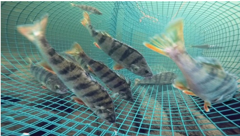
Katiska on mainio keino pyydystää ahventa norppaturvallisesti.

Perusteluissaan valiokunta oli huolissaan Saimaan kalan saatavuudesta. Valiokunta huomauttaa, että Saimaalta pyydetään noin 30 % Suomen sisävesisaaliista, jolloin verkkokalastuskielto vaikuttaisi kotimaisen kalan saatavuuteen. Tämä hieman kummastuttaa, sillä valiokunta kuitenkin totesi itsekkin mietintönsä perusteluissa muikun olevan Saimaan kaupallisessa kalastuksessa tärkein laji, jota jo pyydetään lähes kokonaan norppaturvallisilla pyyntivälineillä, nuotalla ja troolilla.