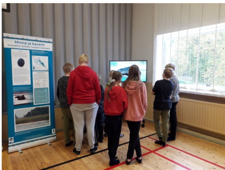
Mobiilinäyttelyä tutkittiin kiinnostuneesti Puhoksen koululla. Norppa ja kuutti -tintamareski on suosittu koululaisten keskuudessa.

Näyttely soveltuu erityisen hyvin koululaisille (alakoulut ja yläkoulut), mutta aikuisten avustuksella se toimii myös päiväkodeissa. Myös aikuiset saavat siitä norppatietoutta mukavassa muodossa, joten esimerkiksi kirjastot, kylätalot tai muut paikat, jossa eri-ikäiset ihmiset kokoontuvat, ovat oivia paikkoja näyttelylle.